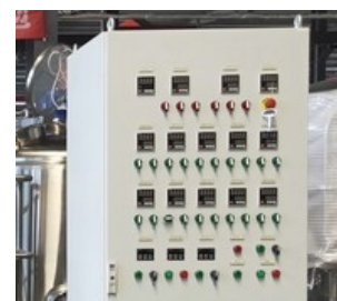
Übersichtliche, automatische Relais-Steuerung der Brauanlage, Gärung, Pumpen, etc.