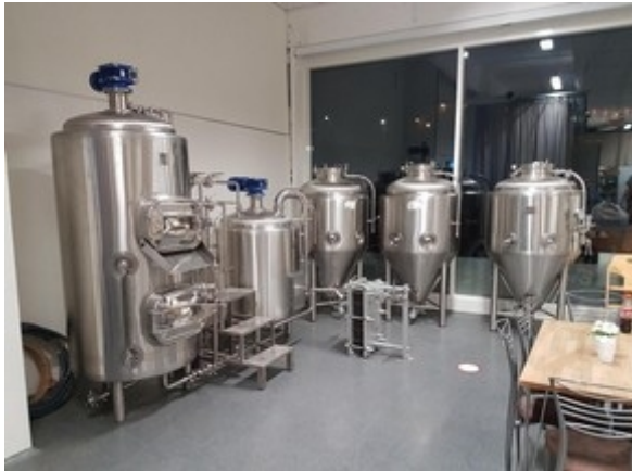
Komplettes 300lt Sudhaus für Gastronomie