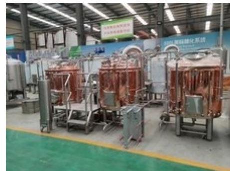
Bsp. 2 Gerätesudhaus 500lt