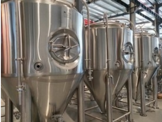
Zylinderkonische Gärtanks ab 200lt bis 10'000lt