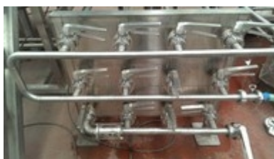
Manuelle Bedienung und Steuerung vom Würzfluss etc. mit manuell zu bedienenden Ventilen