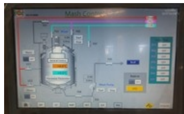
Automatische SPS Steuerung Brauprozess, Würzfluss, Gärung etc. mit Berührungsbildschirm