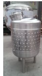
Bsp. Flachboden Lagertank, stehend oder liegend, mit Mantelkühlung (Bild ohne Isolation).