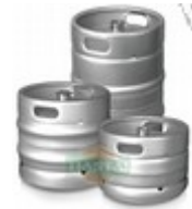
Ausführung Korb- oder Flachfitting Volumen 20, 30 oder 50l