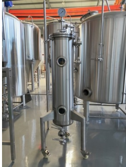
Bsp. Hoggun , mit bierschonender Membranpumpe