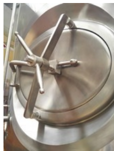
Professionelle Fertigung, auch im Detail sauber