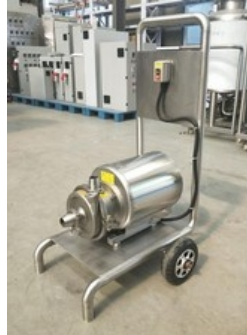
Bsp. Fahrbare CiP Reinigungspumpe (auch mit Heizung)