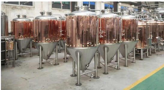
Spezialausführung auch mit Kupfermantel u.a. mit Mantel- und Konuskühlung