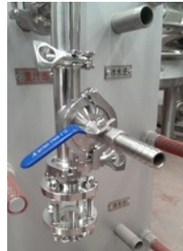
Würzschauglas mit z.Bsp. Sauerstoffzufuhr