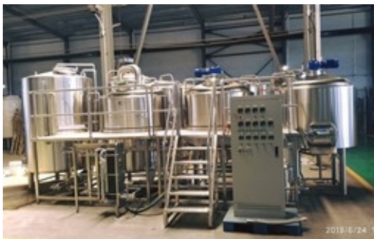
Bsp. 3 Gerätesudhaus 1'000lt