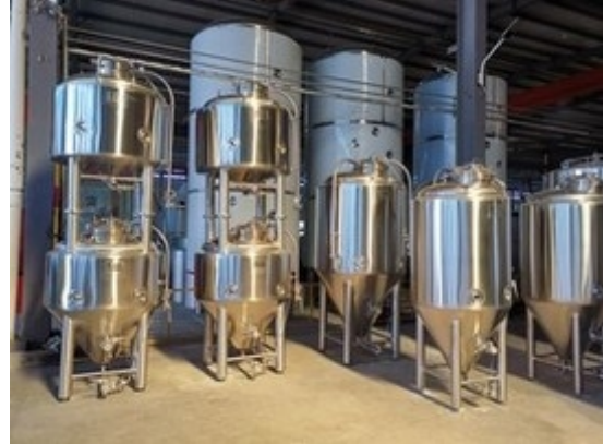
In kundenspezifischen Ausführungen