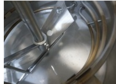
Heizung Sudhaus elektrisch, Gasbrenner oder Dampf