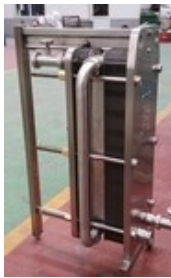
Platten-Wärmetauscher komplett aus Edelstahl, in jeder Grösse

Auch mit Logo Beschriftung. Keg Reinigungsvorrichtung auf Anfrage.