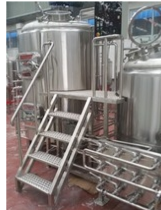
Individuelle 2 oder 3 Gerätesudhaus